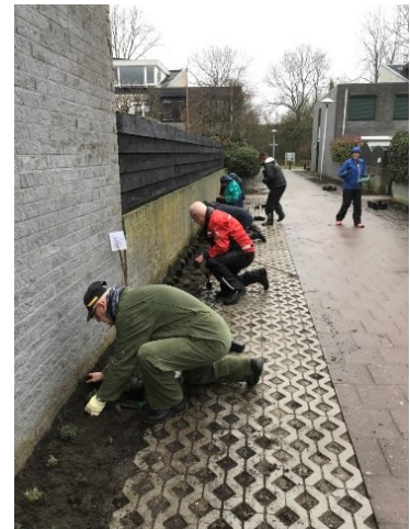
Samen planten in de grond zetten