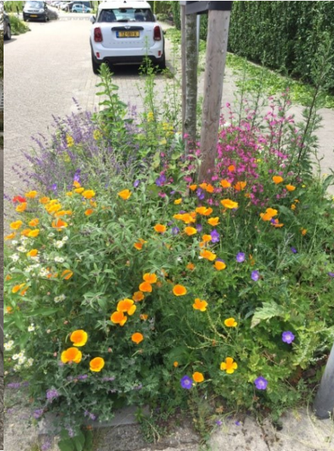
boomspiegel in zelfbeheer