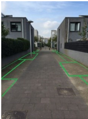
Voor het project

De bewoners hebben een startpakket van heesters en tien soorten (wilde)bijen planten gekregen. De halfopen bestrating is in 2023 ingezaaid met 26 soorten wilde bloemen. Als je, tijdens het schrijven van dit verslag, in maart 2023 door de straat loopt word je omringd door (nog laag) groen en kan je brede en smalle groenvakken onderscheiden. De smalle zogenaamde tuingevelvakken worden onderhouden door bewoners; de brede vakken door de gemeente. Behalve een mooie wandelstraat is de straat nu ook een ecologische verbinding geworden dwars door de wijk lopend. We wachten op de eerste egels.