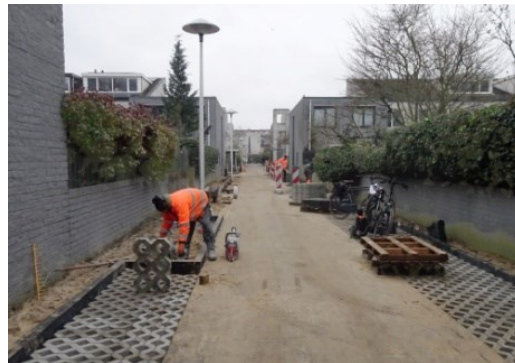
Tijdens de aanleg