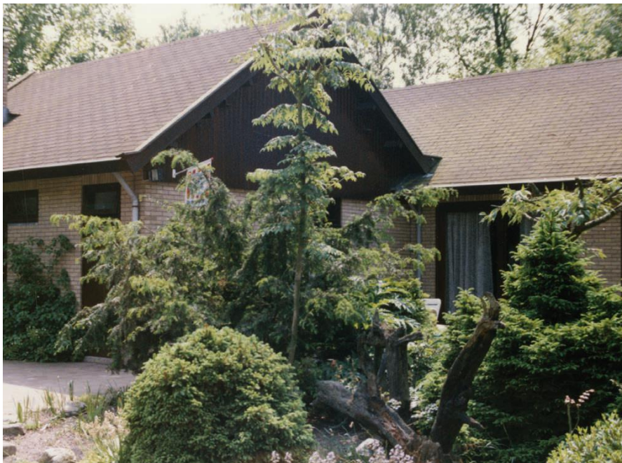
Foto clubhuis in 1989 op diezelfde plek, nog omringd door groen