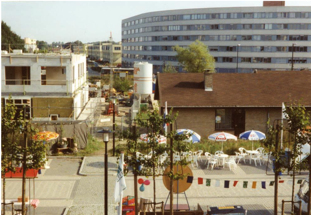
Foto (1993) open dag van het clubhuis tijdens de bouw van het centrumgebied

van de laatste twee decennia nauwelijks levensvatbaar is gebleken,” schreef Hans Lagers. 10 Hij doelt op het voormalige café en de bistro precies op die plek, die een heel ander publiek aantrokken dan Voordorpbewoners en vanaf 2011 en 2012 leeg staan.