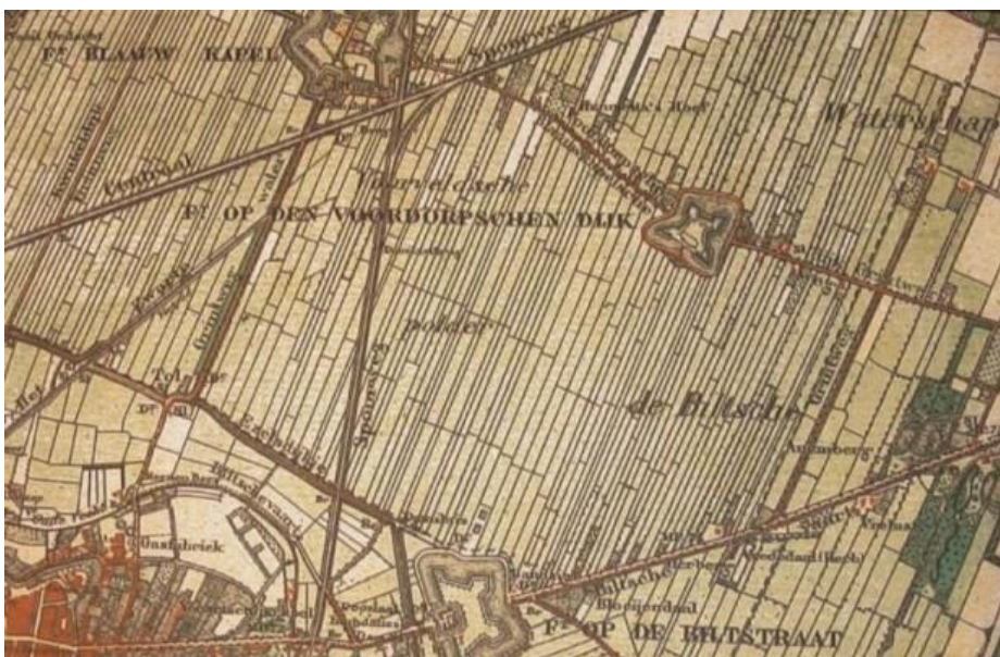
Kaart 1873 ( https://www.ezelsdijk.nl/wordpress/de-ezelsdijk/historie-ezelsdijk/topografische-tijdreis-door-de-ezelsdijk-en-omgeving/ )

Na de ontginning kwam het gebied lager te liggen en werd het Voorveldse Polder genoemd. In de weilanden stonden molens, boerderijen en bomerijen. Aan de noordkant bevond zich het kerkdorp Voordorp. Nadat het kerkje rond 1550 aan de binnenkant blauw was geschilderd heette het dorp Blauwkapel. Aan dit dorp dankt het huidige Voordorp haar naam.