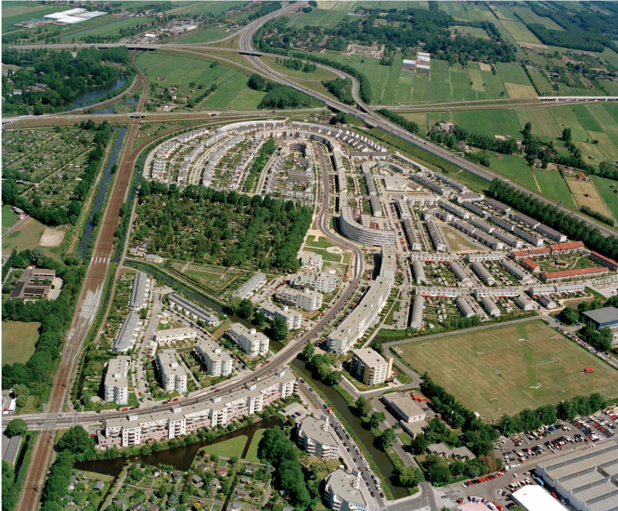
Fotodienst GAU, fotograaf, 1996. Cat.nr. 85392, Het Utrechts Archief